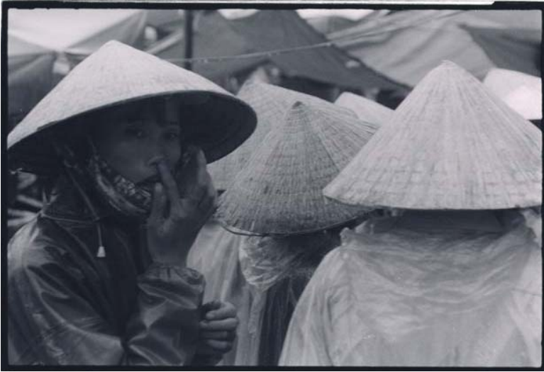
Và những người phụ nữ Việt Nam bình đị tại những khu chợ quê...